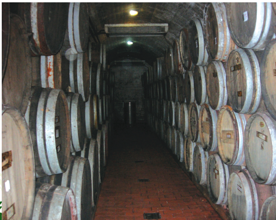
Touristé v Santorini mohou navštívit vinařství a prohlédnout si tradiční „kanava“ (jeskynní otvor ve vulkanické půdě, který je využíván jako sklepení).

V případě Santorini fakticky neexistovala fáze standardizace a globalizace produkce spojená s intenzifikací zemědělských podniků a jejich přeměnou na modernizované farmy (tak, jak je znám tento systém ve všech urbanizovaných oblastech západní Evropy). Následkem toho se iniciativa rozvíjela od svého počátku jako hybrid iniciativy a režimu popsaného ve dvou (výše uvedených) případech. K naprosté modernizaci/globalizaci, jak byl tento proces popsán ve Francii, zde nikdy nedošlo.