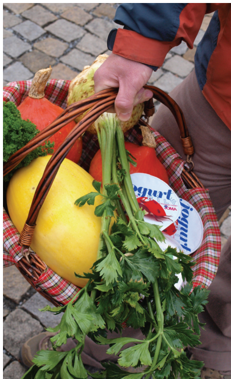
Nákup čerstvé zeleniny a mléčných produktů od místních producentů na farmářském trhu v Plzni.

Jiný příklad z Rennes – rozvoj AMC se stal součástí všech institucionálních rozhodnutí dotýkajících se zemědělství v daném regionu. Dokonce tuto novou iniciativu začaly brát v úvahu také supermarketky jako součást základních spotřebních trendů. Od roku 2000 byl započat nový výzkum (ekonomický, technický i sociálně-vědní) zaměřený