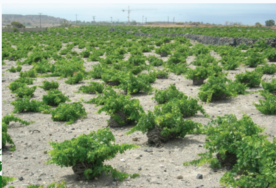
Tradiční vinohrad v Santorini.

produkce zeleniny, anebo příklad nově začínajících farmářů, kteří si pokrokově volí ekologickou produkci (bio). Následně byly popsány čtyři prvky, které jsou nutnými podmínkami úspěchu těchto nových subjektů a mladých farmářů zúčastněných v AMC: strukturované sítě zemědělců sdílející alternativní vizi zemědělství, nový obsah vzdělávacích programů pro zemědělce, strukturovaná společenská poptávka občanů po místních produktech a veřejné politiky reflektující nové požadavky (které se většinou objevují na regionální úrovni).